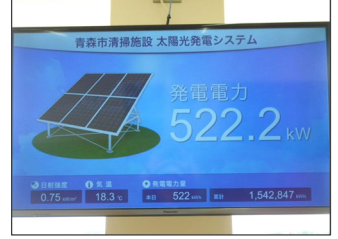
太陽光発電モニタ