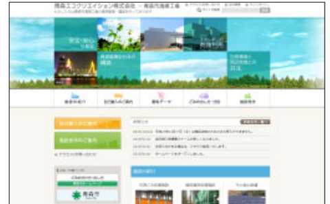
青森エコクリエイション(株)ホームページ