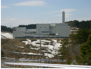
搬入道路からの風景