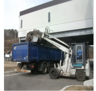
有価金属搬出状況